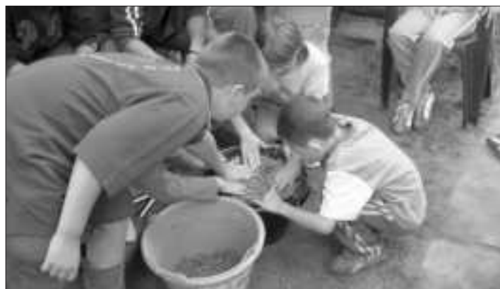
Az etetőanyag készítés rejtelsei

Elérkezett a várva várt nap ahol az elmúlt hét elméleti és gyakorlati tapasztalatait versenykörülmények kö-