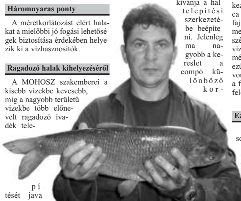
Jászkeszeg a Keletiből (2,5 kg)

A compó egynyaras korosztályának kihelyezéséhez olyan vízszakaszt válasszunk, ahol a lágyszárú és keményszárú növényzet viszonylagos sűrűsége biztonságot nyújt számukra. A horgászati értékes halfajt, a compót egyre több vízhasznosító kívánja a haltelepítési szerkezetbe beépíteni. Jelenleg ma nagyobb a kereslet a compó különböző kor-