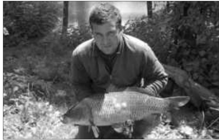
Ponty a Tunyogmatolcsi holtágból