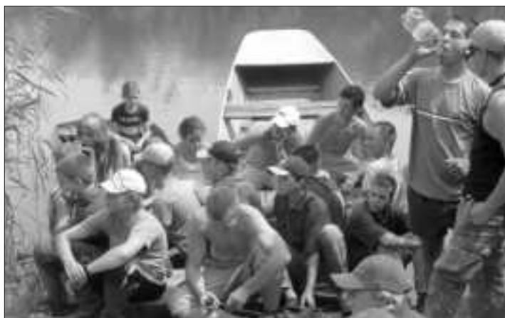
Előadás a tábor lakóinak

zött lehet tesztelni. Az előző nap bemutatott értékes nyeremények a horgász felszerelés és módszerek újbóli átgondolására készítette a gyerekeket. A helyek kisorsolása és elfoglalása után dudaszóra megkezdődött az etetés, majd a három órás verseny kezdetét és végét is újabb dudaszó jelezte.